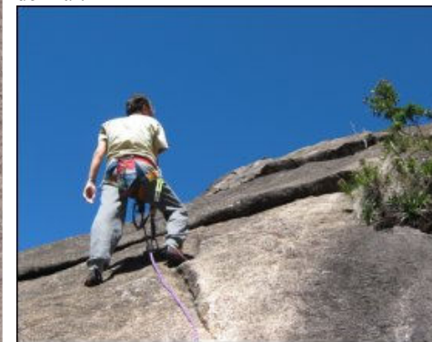
Agenor no Paredão União

Tudo isto coroado por um belo dia de sol, onde se descortinava uma linda paisagem, do Pico do Papagaio, em Aiuruoca, até a Serra do Mar.