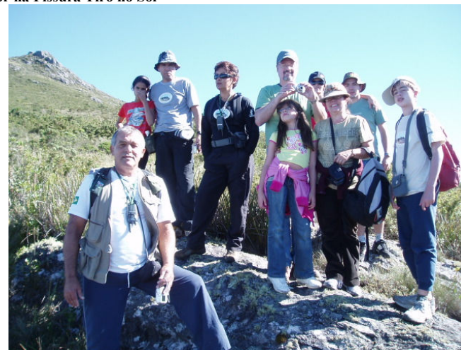
Grupo a caminho da Pedra Furada