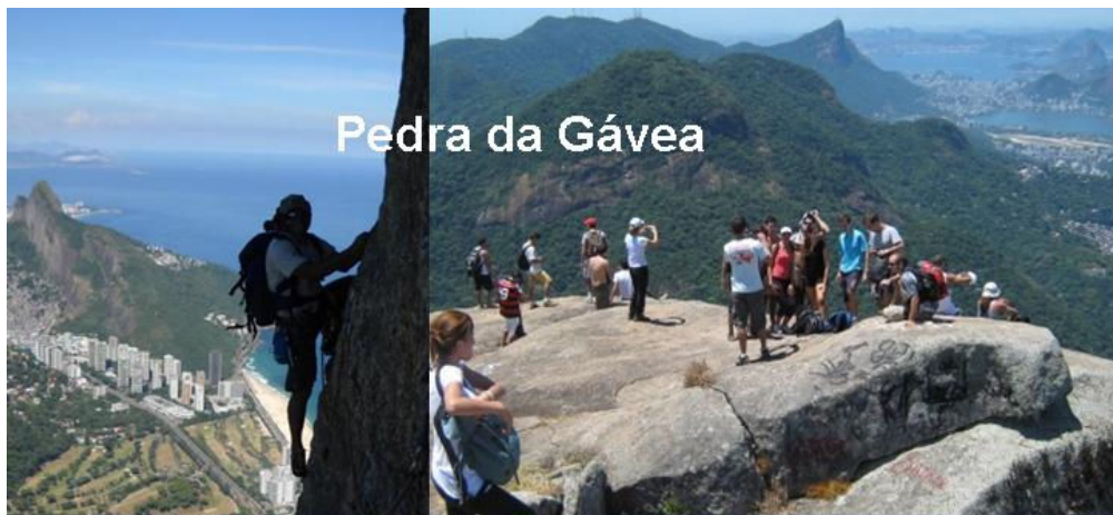
Pedra da Gávea