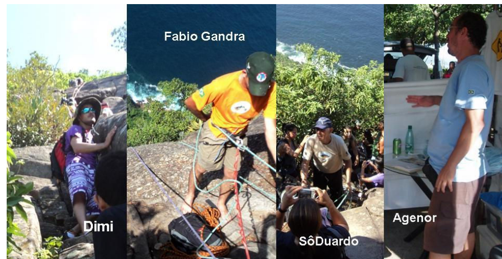
Guias responsáveis pela atividade do dia – Costão do Pão de Açúcar

ao final dessa pista que você tem que transpor com certo cuidado uma torre que marca o final da pista. Dai a caminhada é alternada pela mata e rocha, sempre à beira de precipícios. Até o cume do Pão de Açúcar, o segundo morro é mais alto, são aproximadamente umas duas horas, se for um dia sem congestionamento de montanhistas, como não foi o nosso. De lá, você pode voltar de bondinho de graça, ate o primeiro morro, o da Urca, depois para chegar ao nível do mar há duas alternativas, ou paga para descer no outro bondinho dali até a Pca Gen Tiburcio, ou desce uma trilha bem fácil que dá acesso ao Morro da Urca e deságua no Caminho do Bem-Te-Vi, exatamente o que fizemos.